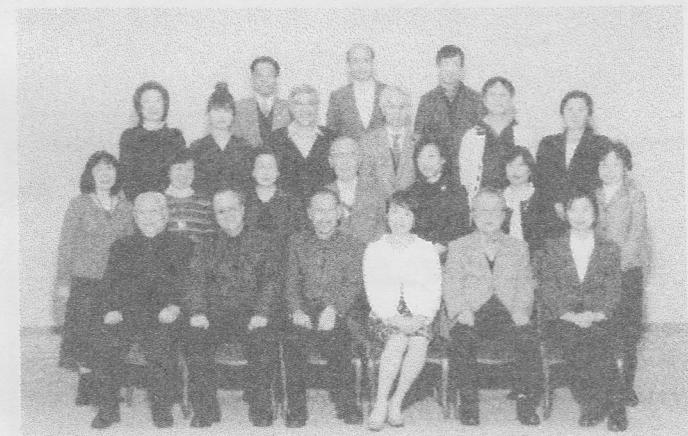
平成26年12月20日 健康生きがいづくりアドバイザー北海道協議会忘年会 設 KKRホテル札幌