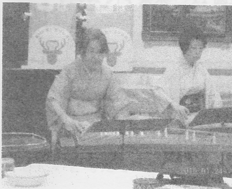
「オアシス藤の会」の皆様