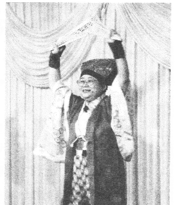
☆明るく元気な家守さんの南京玉すだれ。健康生きがいを身をもって実践される健生北海道の鏡のような方でした。